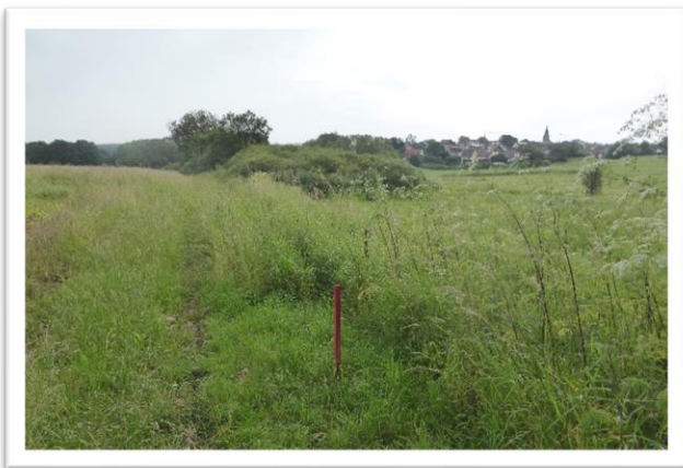
Rote Holzpflocke markieren die Grenzen in der Örtlichkeit

Um die geplanten Rückhaltebecken umsetzen zu können sind vorbereitende Arbeiten notwendig. Bereits im Frühjahr wurden die Grenzen entsprechend des Katasters in der Örtlichkeit kenntlich gemacht. Im nächsten Schritt ist die Anlage einer Baustraße notwendig.